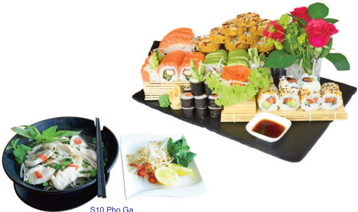
S10 Pho Ga